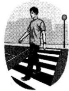
There's a boy walking across the street. Daar is 'n seun wat oor die straat stap.

Longman-HAT se woordeboek bied verdere leiding ten opsigte van voorsetsels in die middeltekste aan. Hierdie suksesvolle leiding word soos volg aangebied: